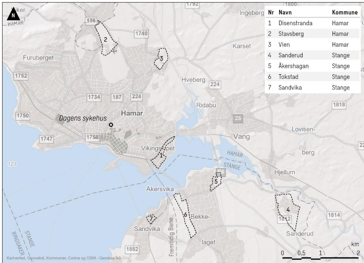
Figur 2 - Tomter som er vurdert for erstatningssykehus Hamar i Hamar og Stange kommune

Tomteanalysens del 1, som nå sendes på innspillrunde, omfatter utredning og evaluering av innkomne tomteforslag innenfor de to retningsalternativene. Prosjektets styringsgruppe gjorde følgende vedtak 6. april: