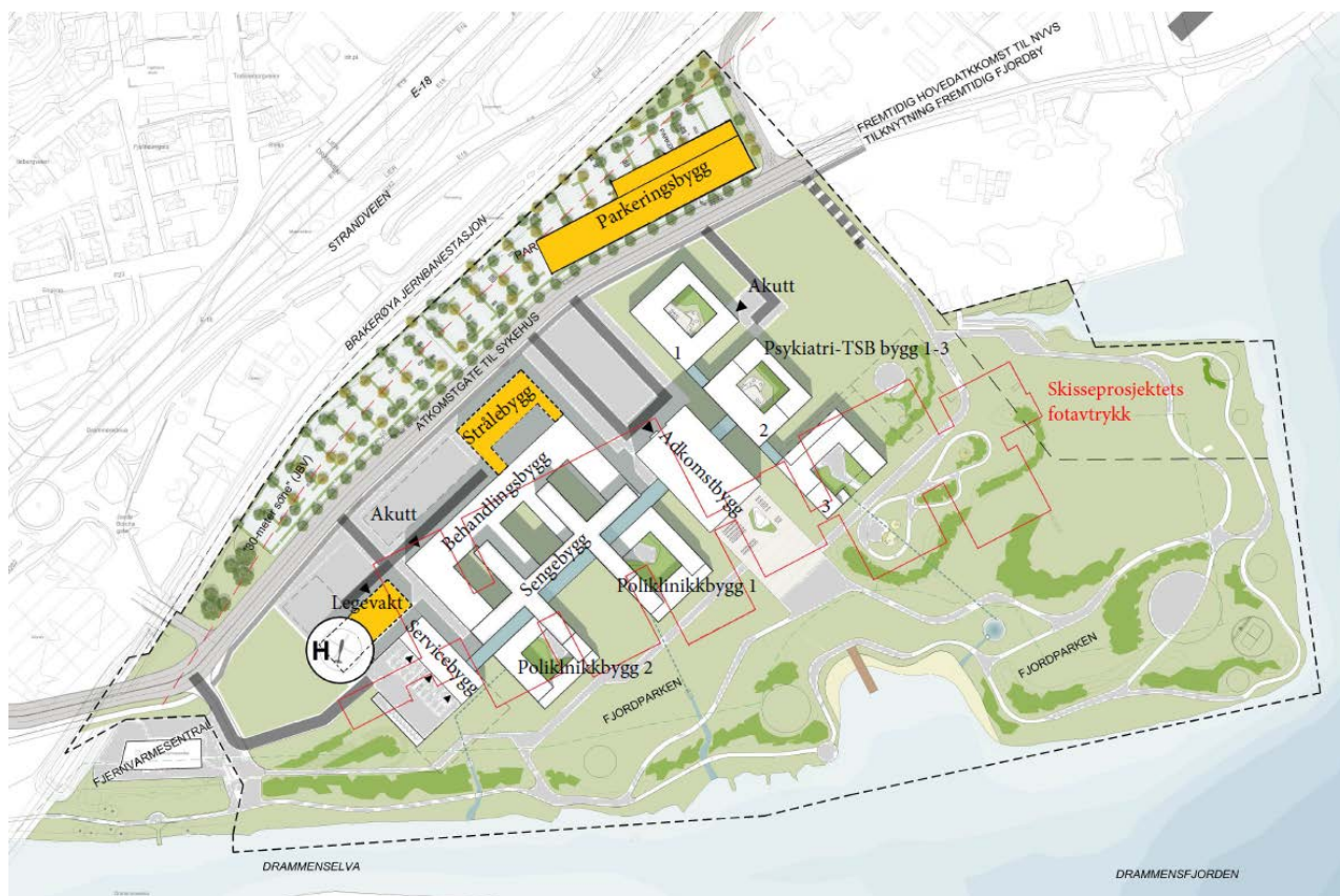
Figur 1 Illustrasjon av ny basismodell

Den nye basismodellen gir kortere avstander i bygget og det vurderes som en fordel for all logistikk både med hensyn på pasienter, personell og vareflyt.