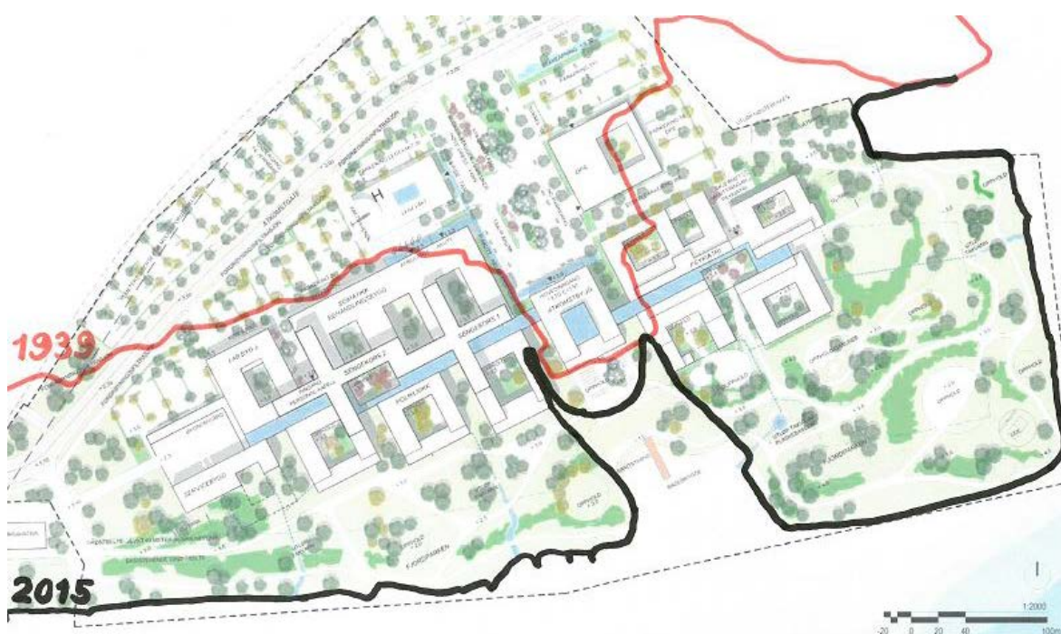
Figur 3 Utfylling over tid

Området er i all hovedsak fylt ut med avfall fra den industrien som har hatt sin virksomhet på Brakerøya, samt at store deler også er fylt opp med sprengstein fra anleggsvirksomhet i nærheten. Det har de senere år vært gjennomført omfattende kartlegging og opprensning av forurensning på områder som ikke er bebygget. Risikoen knyttet til forurensning er knyttet til usikkerhet til situasjonen under byggene, da særlig knyttet til bygningsmassen som disponeres av ABB. På grunn av virksomheten i byggene, samt krevende bygningsmessige konstruksjoner, har det ikke vært mulig å utføre boreprøver under eksisterende bygg. Det er imidlertid god kunnskap om forurensningssituasjonen generelt på tomten fordi rådgiverne fra Multiconsult har fulgt utviklingen av tomten i flere tiår, og kjenner tidligere kartlegginger og gjennomførte tiltak godt.